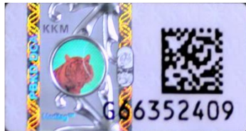
Label keselamatan hologram Meditag™ 4