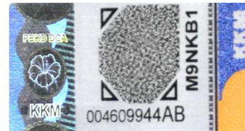
Label keselamatan hologram Farmatag™